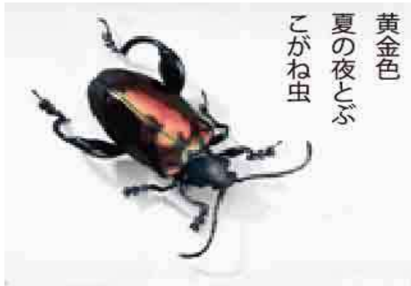
黄金色 夏の夜とぶ こがね虫