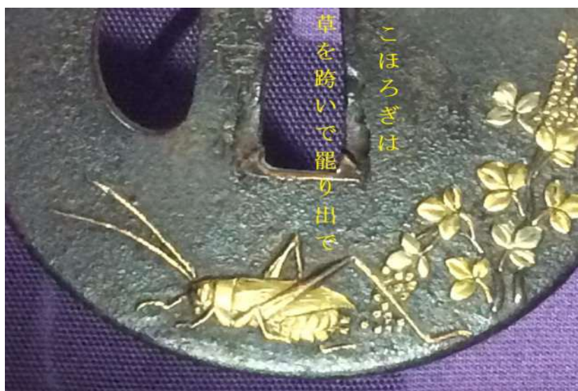
まか こほろぎは 草を跨いで罷り出で