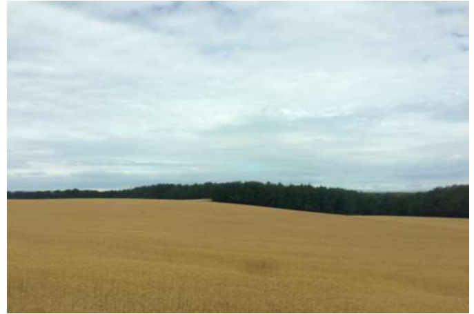
花咲く6月（左）と7月、金色に実ったヨークシャーの垂麻畑（右）です。