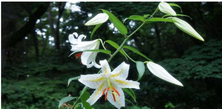
自然教育園（目黒）の山百合