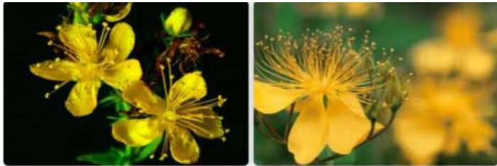
St.John's Wort : セント・ジョンズ・ワート (セイヨウオトギリソウ)