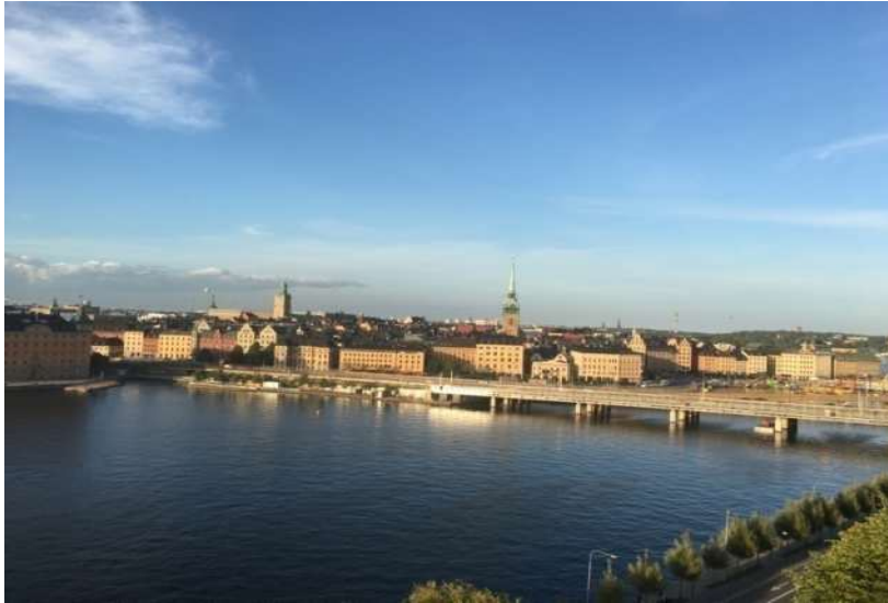
ストックホルムの橋