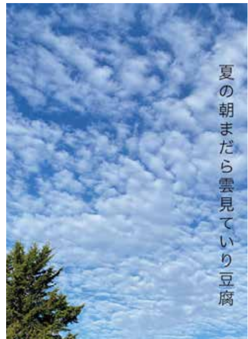
夏の朝まだら雲見ていり豆腐 (季語：夏の朝=夏) 陽閑