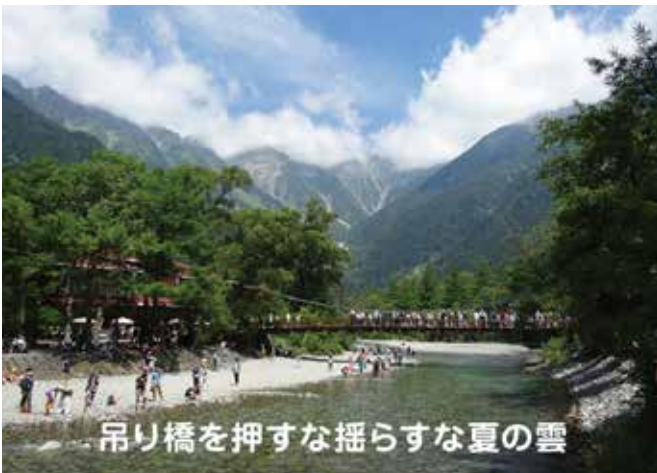
吊り橋を押すな揺らすな夏の雲 (季語：夏の雲=夏) 久井