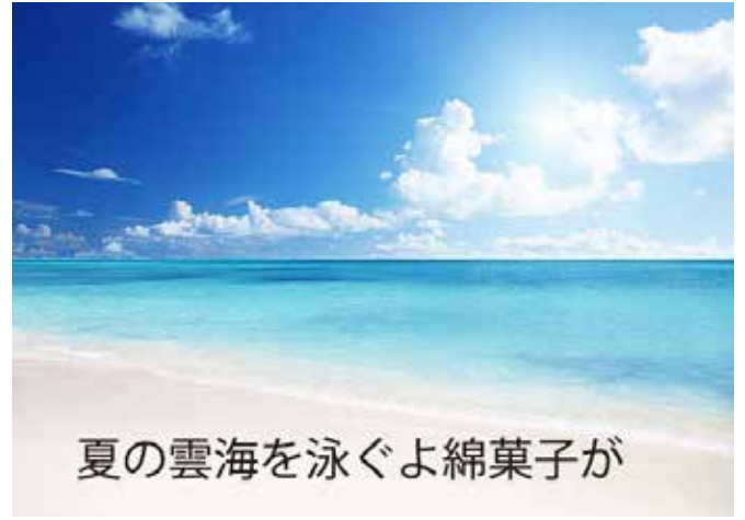
夏の雲海を泳ぐよ綿菓子が (季語：夏の雲=夏) 梵木