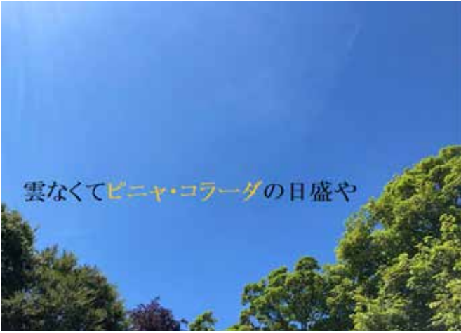
雲なくてピニャ・コラーダの日盛や (季語：日盛=夏) 北切雀