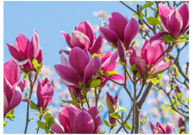
春 (3・4月) イメージ: モクレン