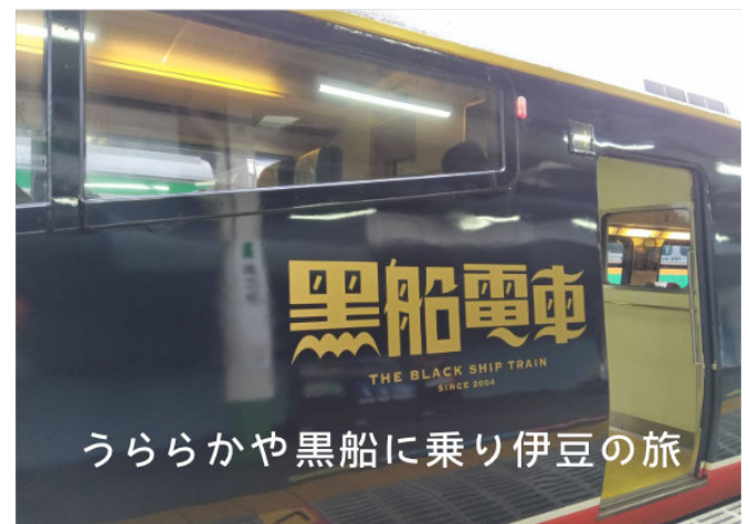
うららかや黒船に乗り伊豆の旅 (季語: うららか=春) 水澄