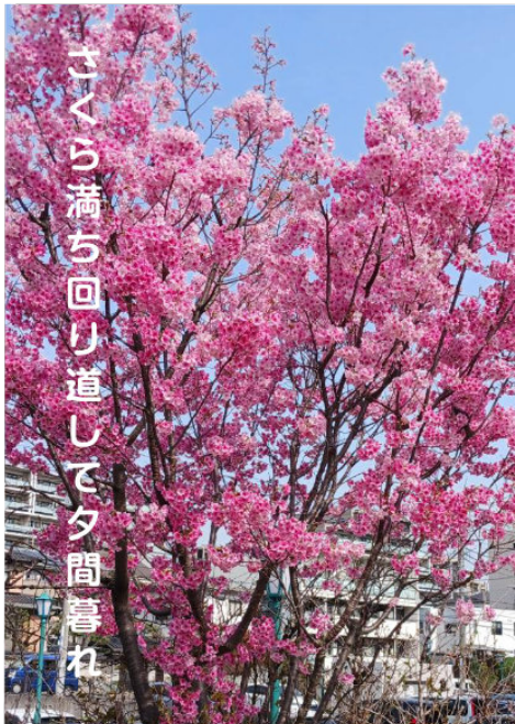
さくら満ち回り道して夕間暮れ (季語: さくら=春) 久芽