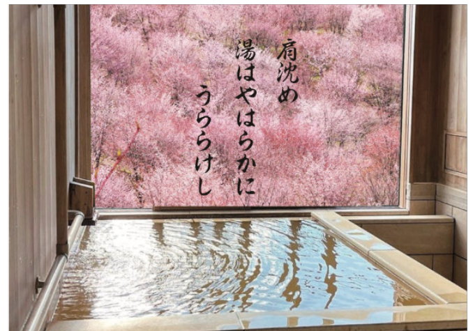
肩沈め湯はやはらかにうららけし (季語: うららけし=春) 池福楼