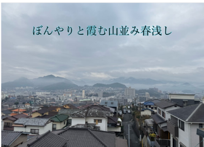
ぼんやりと霞む山並み春浅し (季語: 春浅し=春) 千泉